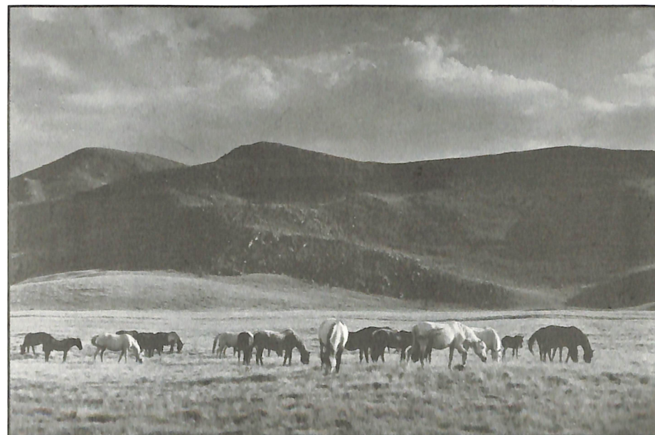
Гилески Дејан - Гиле БИСТРА 93/1