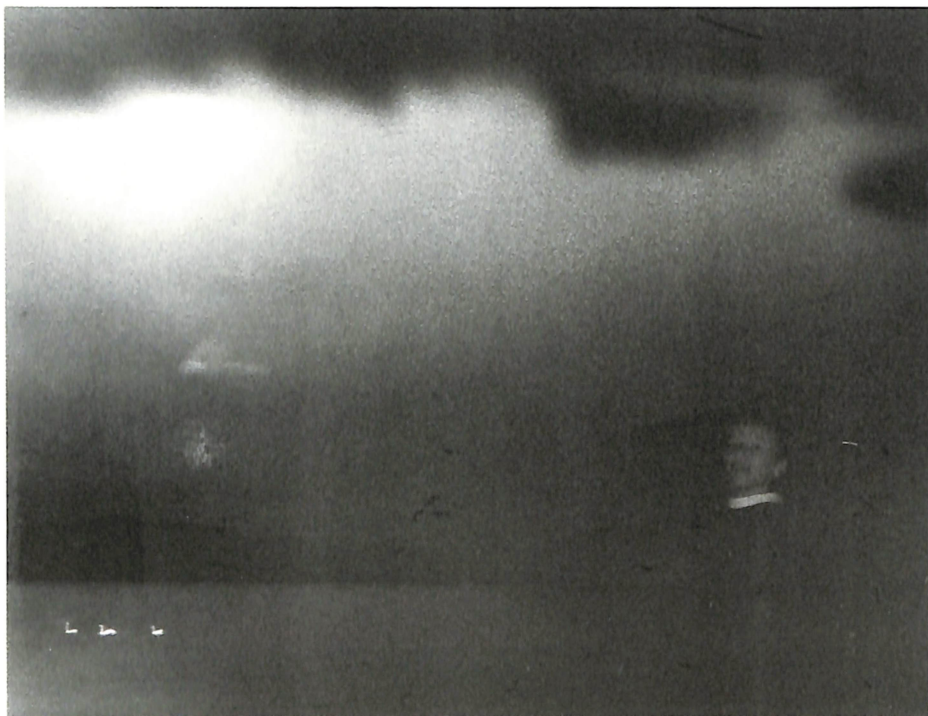
Горгоноски Лазо ЕФЕМЕРЧЕ 11