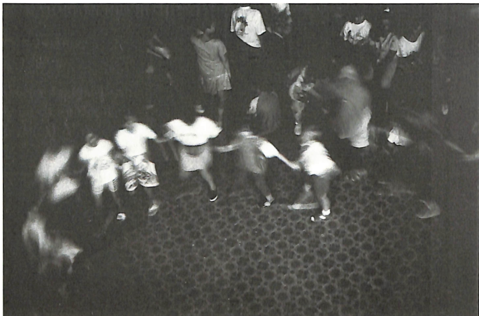
Петрески Боби ДЕТСКА ИГРА III