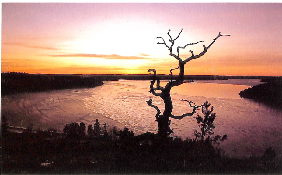
Петрески Боби „С-1”

На насловната страна: Бајрам Маџит „Ф 91/1”