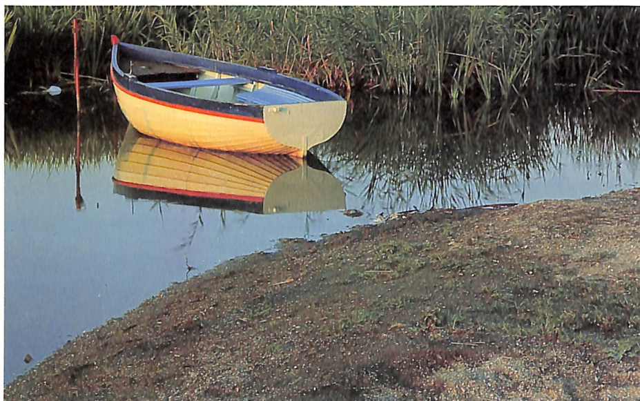
Бајрам Ерол „ДИЈА 7/93”