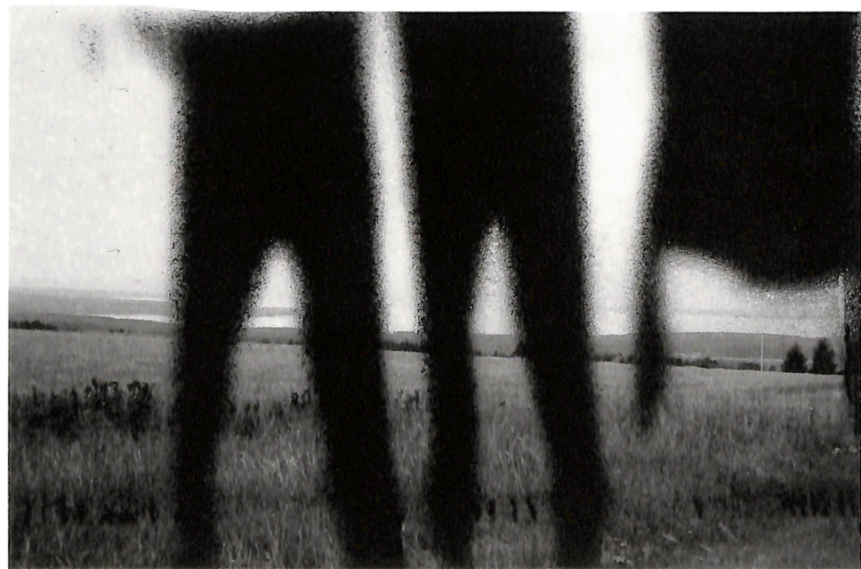
МАЏИТ БАЈРАМ "61/96 S"