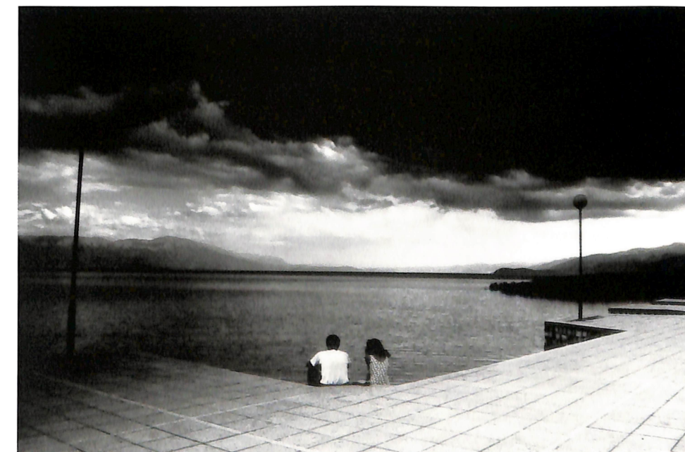
АНГЕЛ НЕСТОВ "БИСЕР"