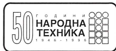
Фото сојуз на Македонија ФКК "Вардар" - Велес ОК на Народна техника - Велес