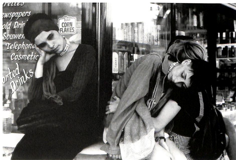
РАДОЈ ГЛИШИЌ "БЕЗ НАСЛОВ"