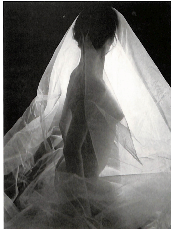
БИЉАНА ЈУРУКОВСКА "НОЌИТЕ ВО РОЗОВ СЕТЕН"