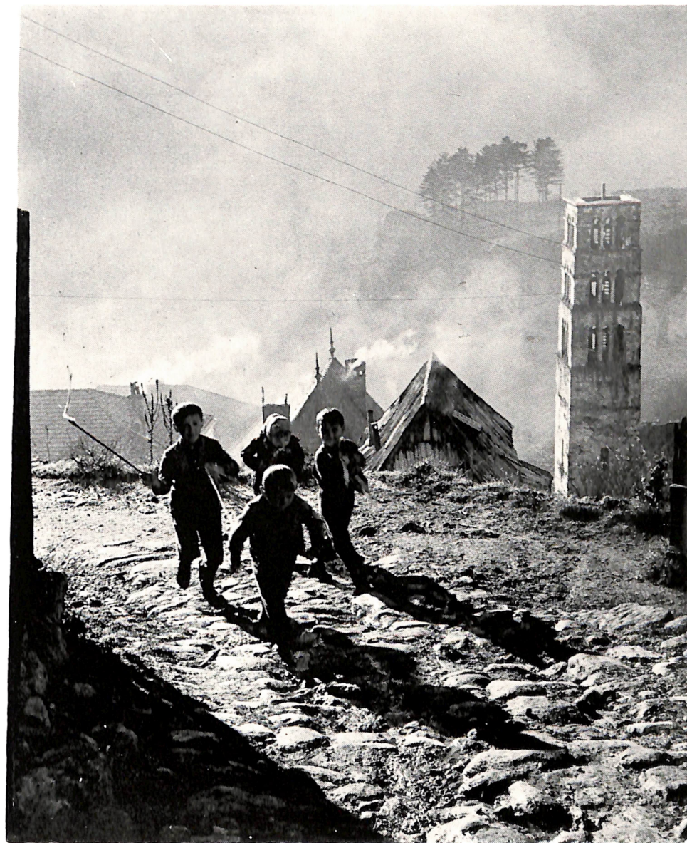
Gojko SIKIMIĆ — Sarajevo — JUTRO