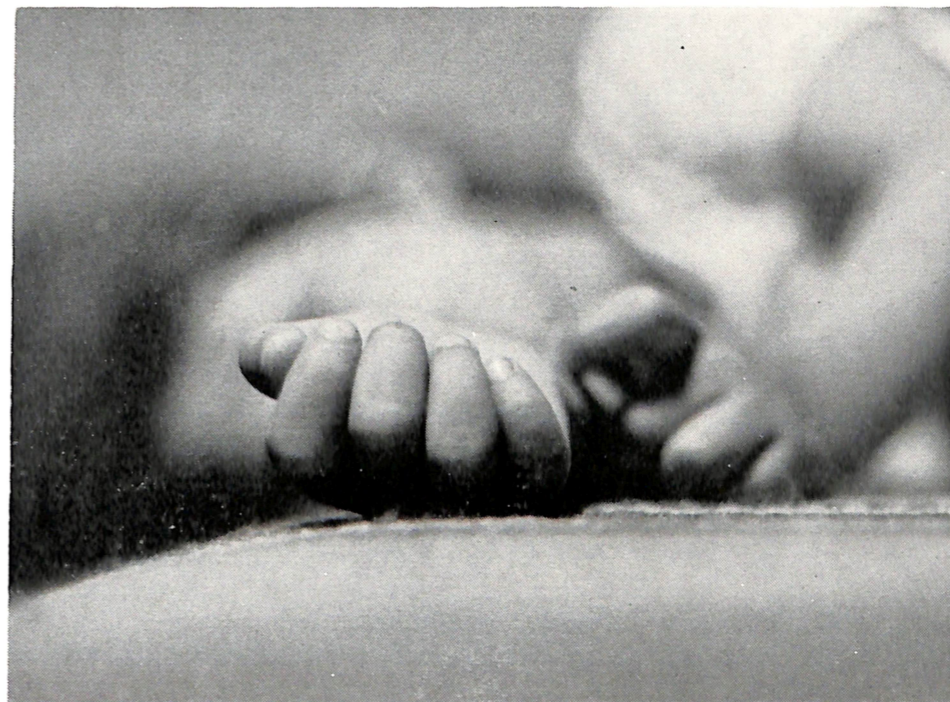
Đorđe LUKOMSKI — Borovo — SAN