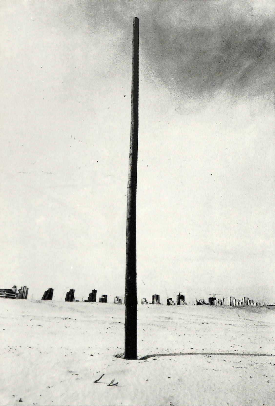
„Пустински пејзаж“ Никола Татиќ