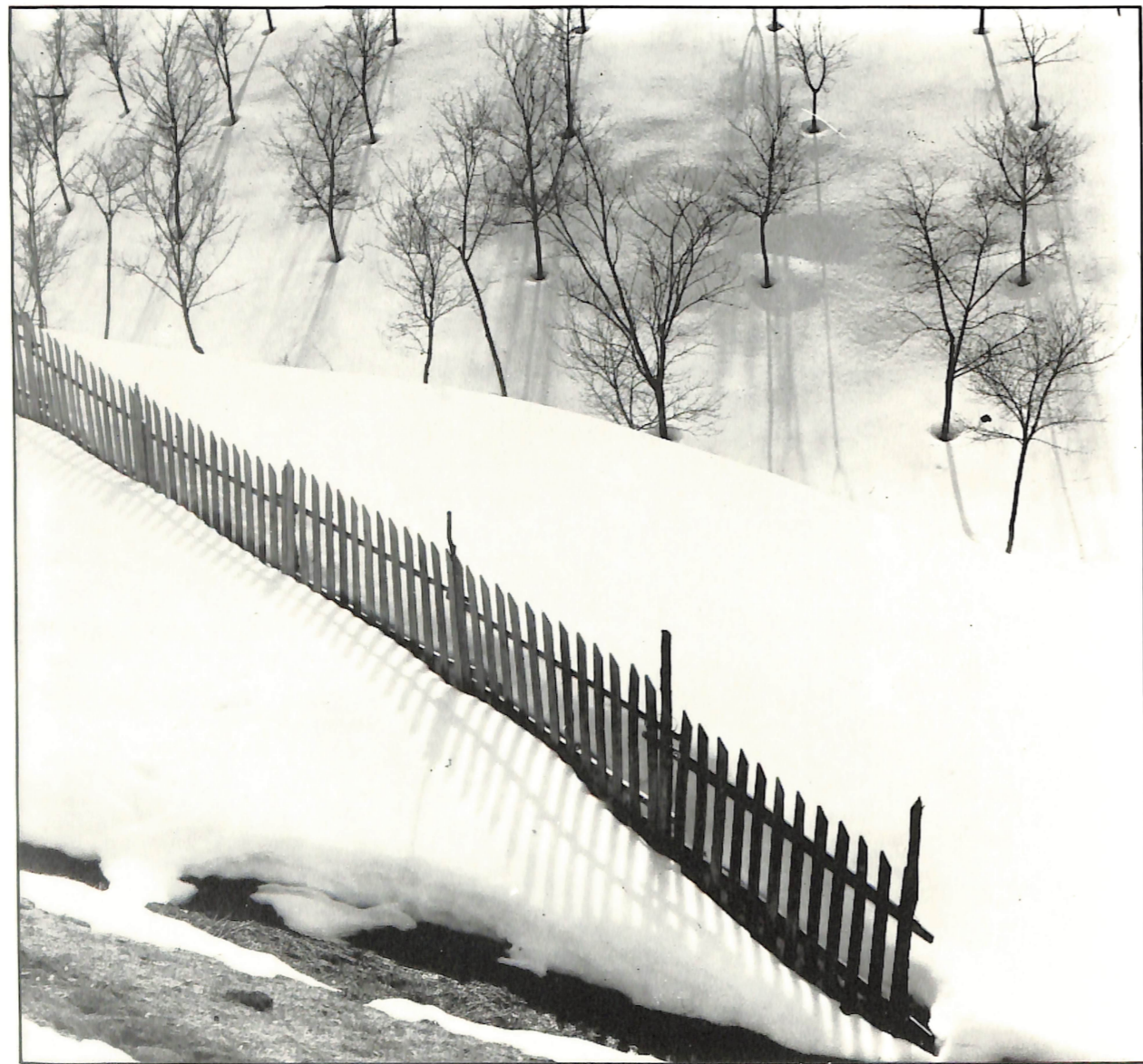
„Зимски пејзаж III“ Милан Марковиќ