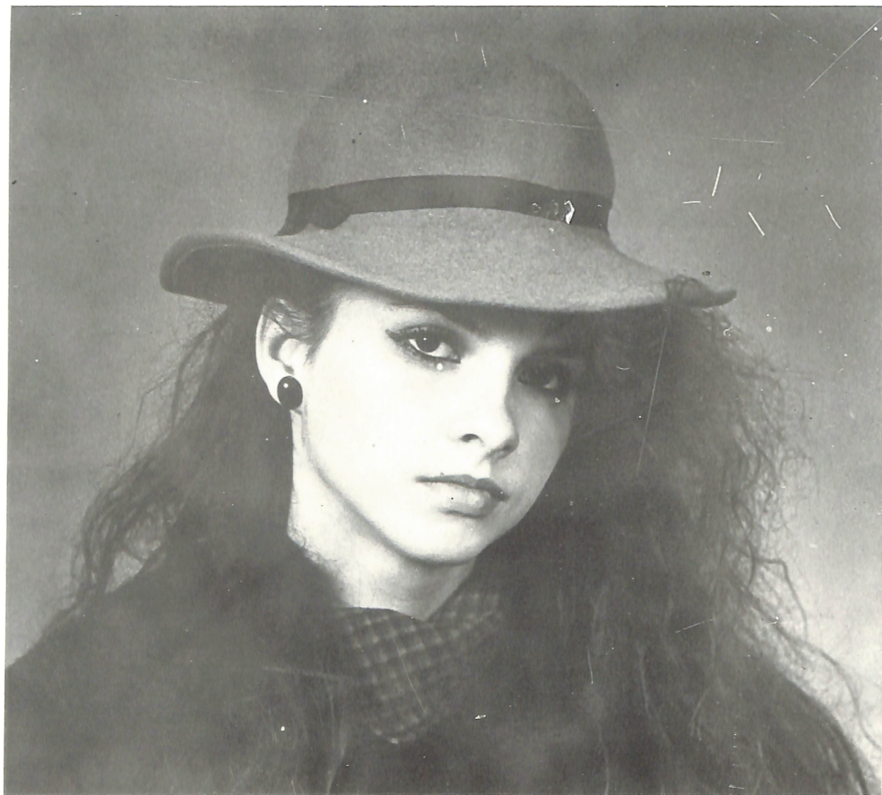
„Јулија I“ Ацо Манчев