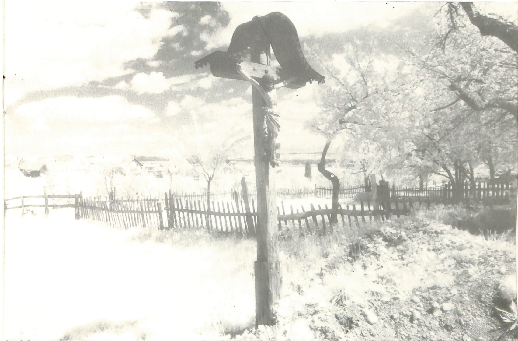
„Изрочило“ Бранко Конишек