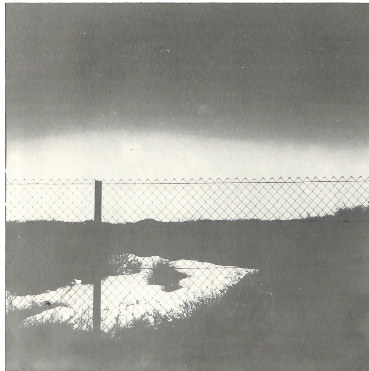
„Марлера 81“ Ангело Божац