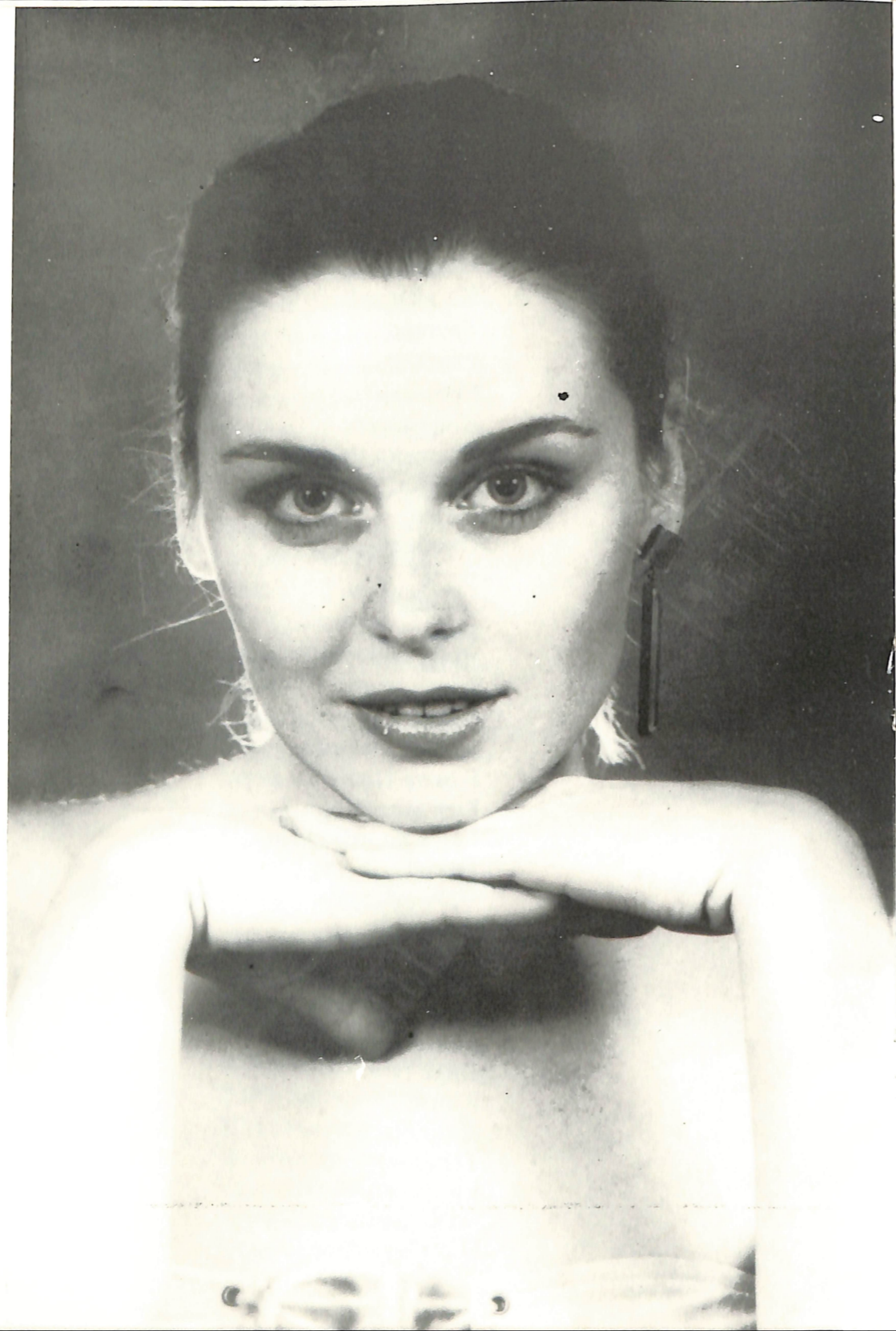
„Анатомија страсти“ Ангело Божац