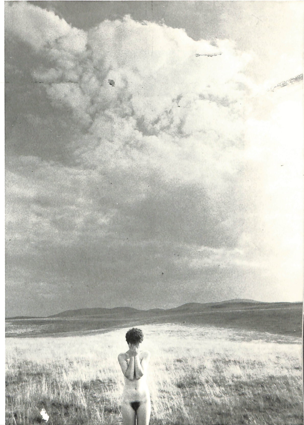
„Лето 85“ Зоран Ѓорѓевиќ