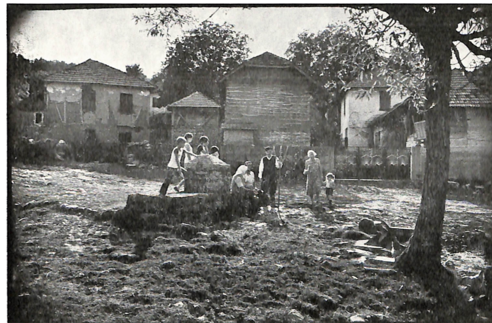
I Nagrada — pojedinačne NA ČESMI Rade Milisavljević FK »Beograd«