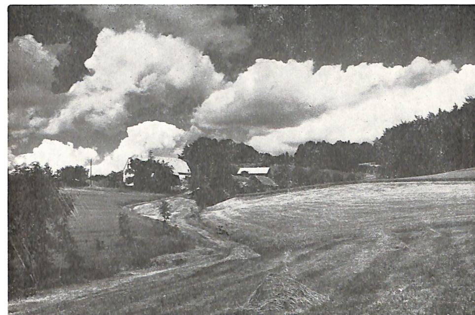
III Nagrada za kolekciju Nande Bobič, FKT »TAM Maribor« DOMAČIJA