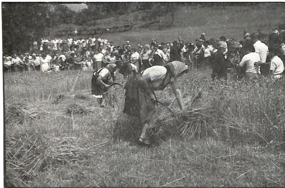
TAKMOVANJE ŽANJIC — I