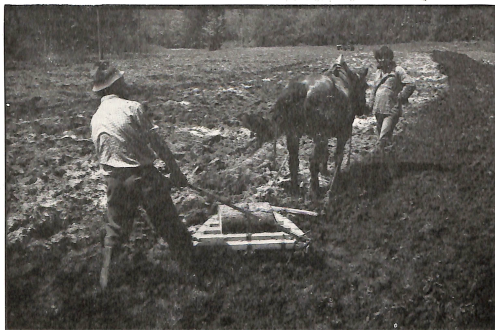
KMETOVALEC — I